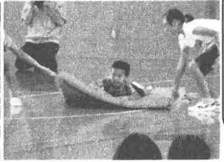
6年生によるマットリレー