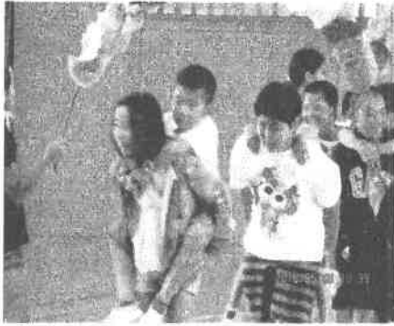
6年生におんぶされ入場する1年生

全員での合唱の後には、二・四・六先生を中心にダンス・ゲームを行い、全児童で楽しい一時を持つことができました。