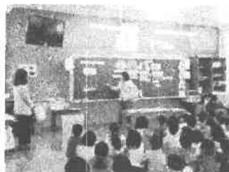
【1学年 紙芝居を使った教室の様子】