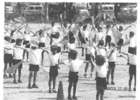
【2年生 校歌ダンス練習】

これから運動場や体育館で過ごす時間が長くなります。水分補給や休息をとりながら進めていきます。各家庭においても体調面への配慮や管理等をお願いします。