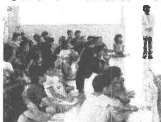
【4学年 アニメから「いじめ」を考える】