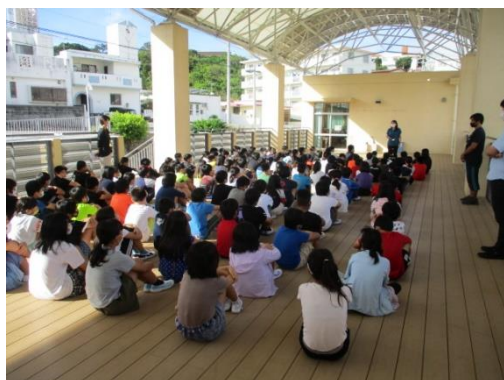
【話す人の方向を意識して聞く5年生】

3密を防ぐことで、中止にしていた学年朝会を9月17日より再開いたしました。各学年で場所を変え、行事や学校の決まりについて共通理解を図ります。