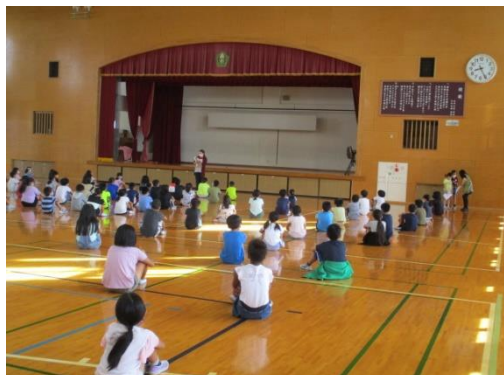
【姿勢良く参加する3年生】

3密を防ぐことで、中止にしていた学年朝会を9月17日より再開いたしました。各学年で場所を変え、行事や学校の決まりについて共通理解を図ります。